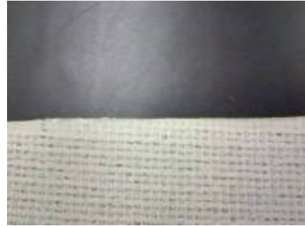
ワニスコットカット面 (特殊溶着カット)