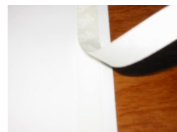
※製品裏面は 粘着材で固定可能