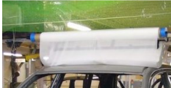
クリーナーロール使用例