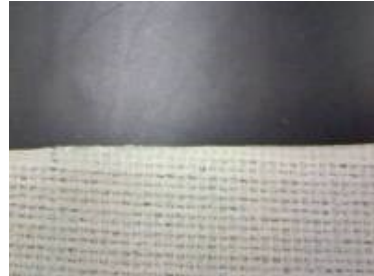
ワニスコットカット面 (特殊溶着カット)