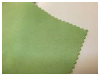
端末ピコソグカット処理