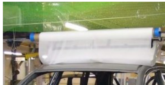
クリーナーロール