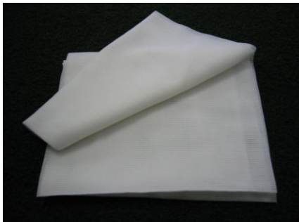
クリーナーコット

極めて高度な仕上り精度が要求される製品塗装面を清掃する拭取り具。 塗装面に付着したダスト類を除去します。 粘着剤の塗面や作業者の手等への移行は少なく、拭取り性に優れます。