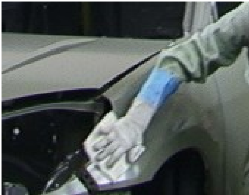
クリーナーコット