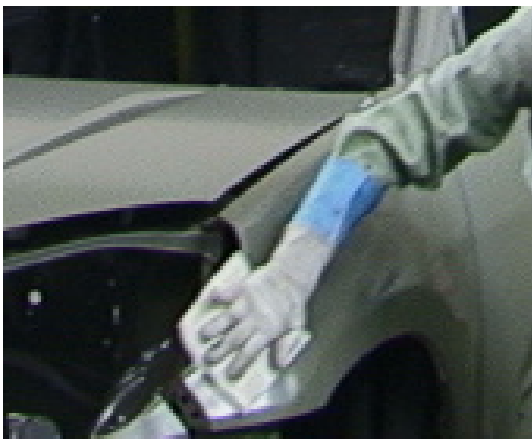
クリーナーコット