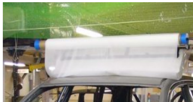
クリーナーロール